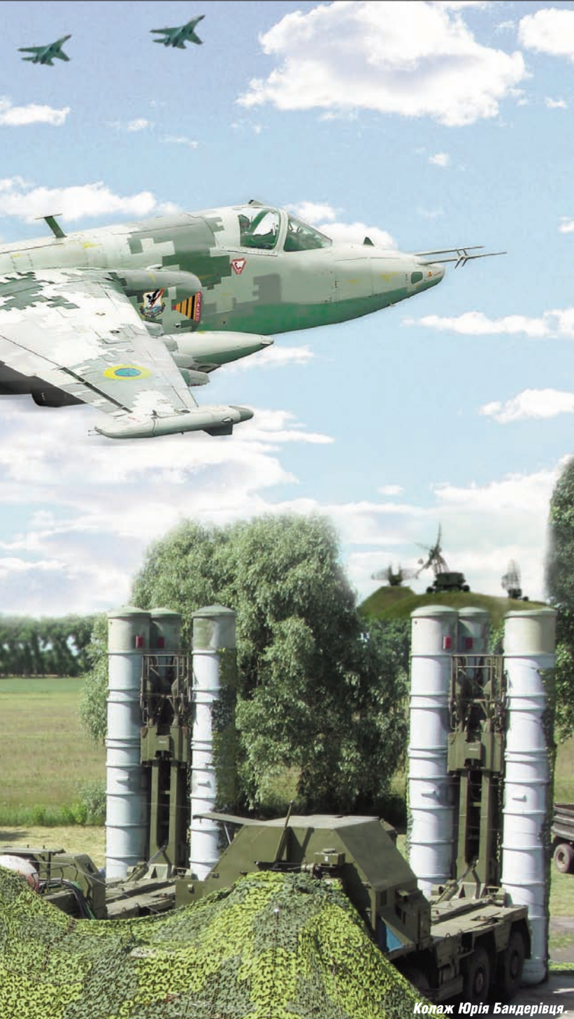
Колаж Юрія Бандерівця

ливо у регіонах з нестабільною суспільно-політичною обстановкою. Як показав досвід, в умовах дій диверсійно-розвідувальних груп та злочинних угруповань неможливо у повному обсязі самостійно вирішити завдання як бойового застосування, так і охорони та оборони позицій окремого розташованих підрозділів штатом мирного часу.